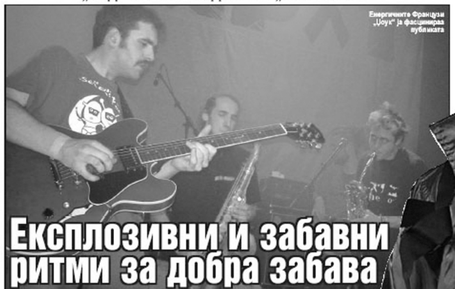
Енергичните Французи „Џоук“ ја fascinираа публиката

„Неделно попладне“, како што беше насловена втората вечер од придружните настани на „Таксират 9“, која се одржа зајечера вечер во концертната сала на МКЦ, помина во знакот на ска, реге и панк-звучите. Мешавината на различните музички правци, кои донекаде имаат заедничка музичка основа, ја подгрева атмосферата, а публиката се размира.