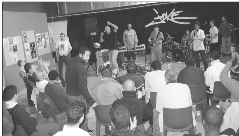
MEUX-CHAUCONIN, CENTRE PENITENTIAIRE, HIER A 14 H 30. Une quarantaine de détenus ont assisté au concert. Certains se sont levés pour danser et même chanter.

GUÉNAËLE CALANT * Deux journalistes de la radio 77 FM assistaient au concert. Un reportage est prévu sur leurs ondes (95.8) aujourd'hui.